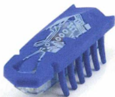
HEXBUG nano brouk – tmavě modrý