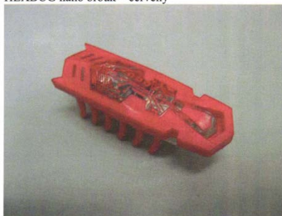
HEXBUG nano brouk – červený