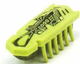
HEXBUG nano brouk – zelený