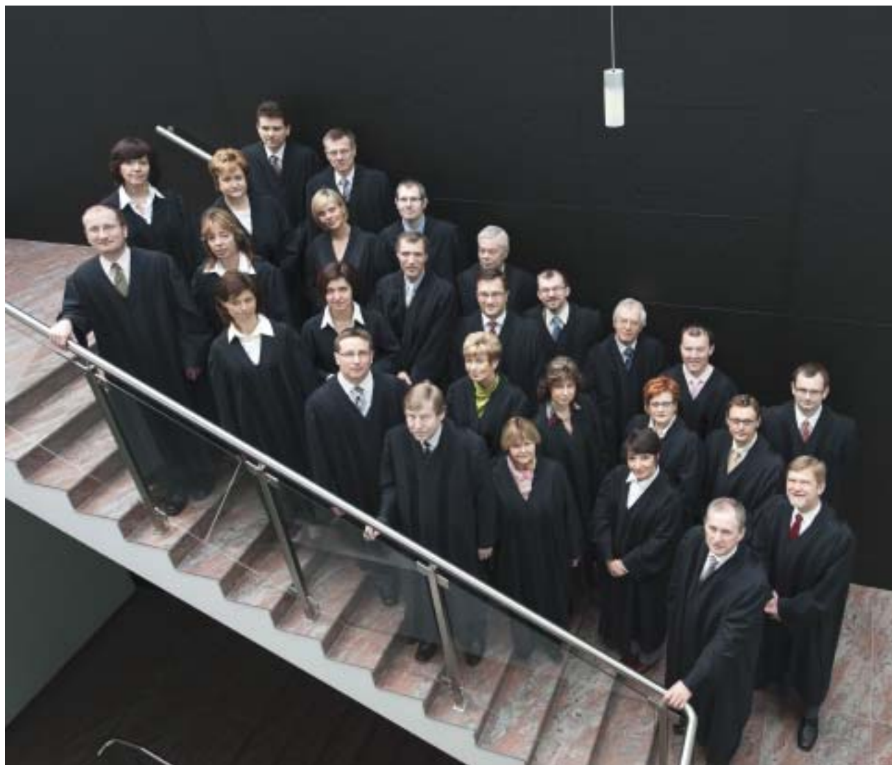
Plénum Nejvyššího správního soudu