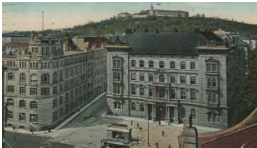
Lažanského náměstí s vyústěním Solniční ulice (kolem roku 1900)