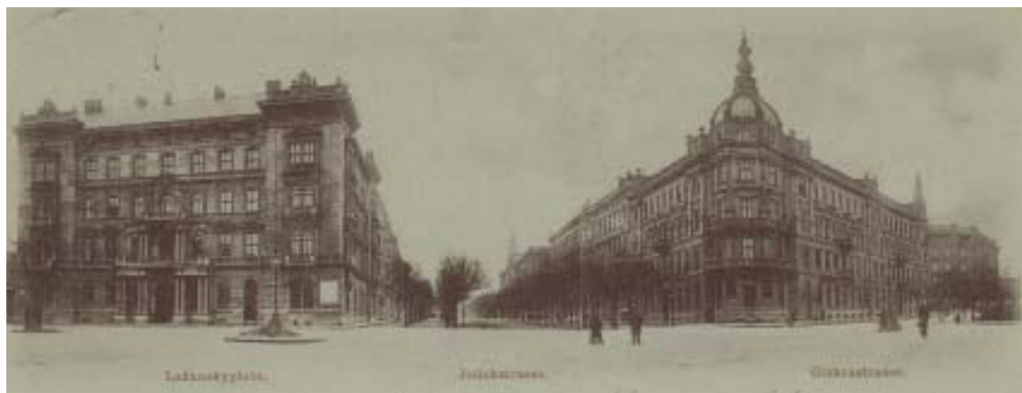
Pohled do Joštovy třídy