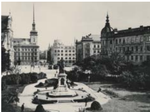
Pohled na Lažanského náměstí od bývalého Německého domu (v parku socha císaře Josefa II.)